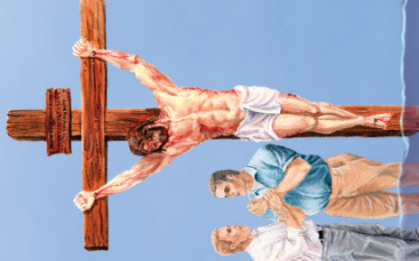
Mati Dari Dosa