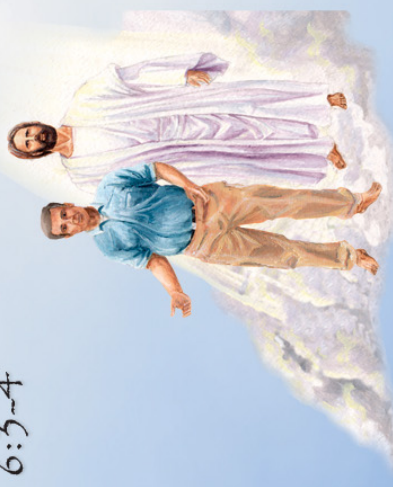
Bangkit ke Kehidupan Baru